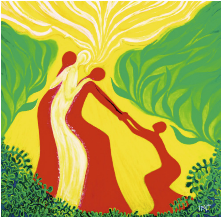
Steht auf für Gerechtigkeit – Weltgebetstag 2012