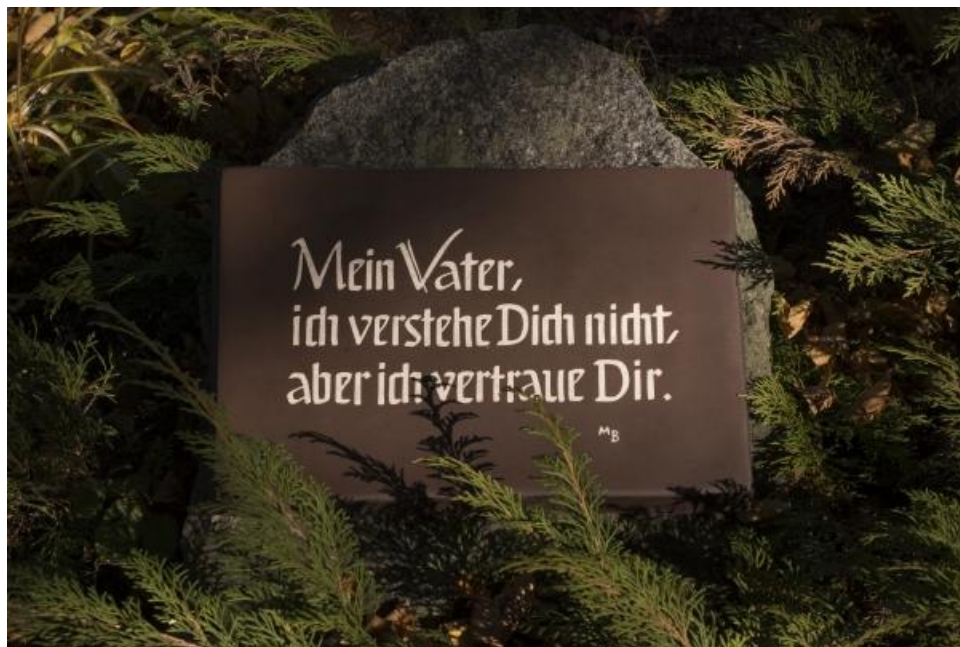
Friedhof Hundshübel