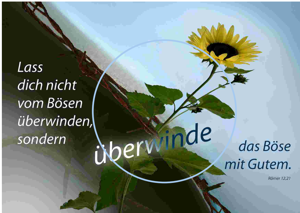
Jahreslosung 2011