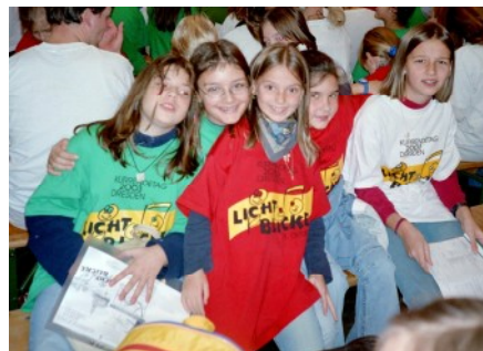
Zum Kurrendetreffen 2003 in Dresden