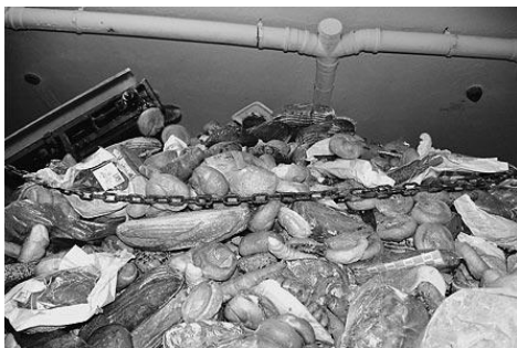
In Wien wird täglich soviel Brot vernichtet, wie Graz verbraucht.

In dem Dokumentarfilm von E. Wagenhofer werden die Strukturen des globalen Lebensmittelhandels durchleuchtet und die lokalen Folgen aufgezeigt. Sicher wäre es gnädiger, manches nicht so genau zu wissen, doch nach diesem Film kann niemand mehr sagen: „Wenn ich das gewusst hätte...!“