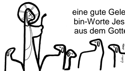
Jesus spricht: Ich bin der gute Hirte

eine gute Gelegenheit. Das Thema dieses Jahres sind die Ich-bin-Worte Jesu im Johannes-Evangelium. Manche davon sind aus dem Gottesdienst bestimmt bekannt, andere vielleicht nur ohne ihren Zusammenhang im Gedächtnis hängen geblieben. Mit den Gottesdiensten und Abenden wollen wir diesen Worten Jesu nachgehen, die uns zu Fenstern zum Himmel werden können. Beginn jeweils um 19.30 Uhr