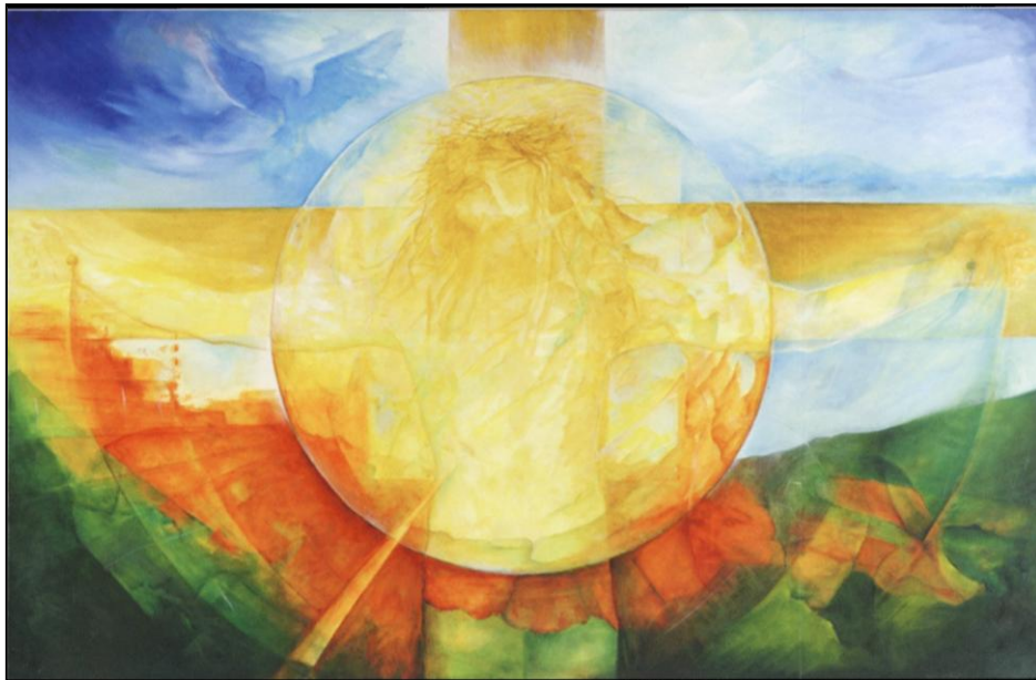
„Siehst du mich?“ ökumenischer Kreuzweg der Jugend