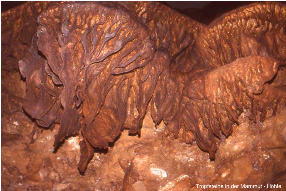
Tropfsteine in der Mammut - Höhle

Jesus Christus spricht: Ich lebe und ihr sollt auch leben. Joh. 14,19