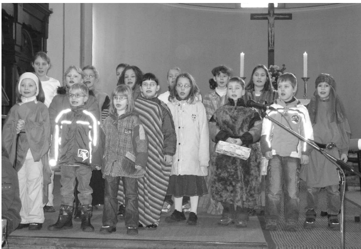
Abschlussgottesdienst der Kinderbibeltage Neukirchen