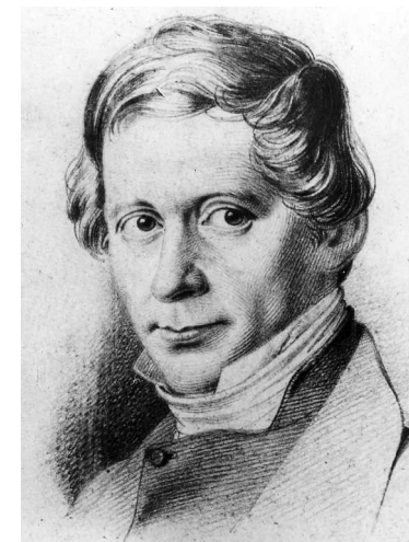
Johann Hinrich Wichern

Sein Werk besteht fort: Das „Rauhe Haus“ und das Berliner Johannesstift gehören zu den renommiertesten und größten diakonischen Einrichtungen Deutschlands. Und dass die Diakonie heute unverrückbarer Bestandteil der evangelischen Kirche ist, geht letztlich auf Johann Hinrich Wichern zurück. Ein gewichtiger Grund also für die evangelischen Kirchen, im 200. Geburtsjahr des Reformers ein „Wichern-Jahr“ auszurufen.