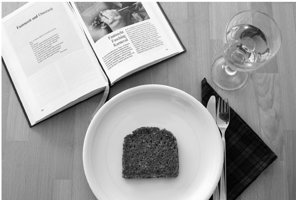
Fastenaktion 7 Wochen ohne – von Aschermittwoch bis Ostern

Jesus Christus spricht: Ich lebe und ihr sollt auch leben. Johannes 14,19